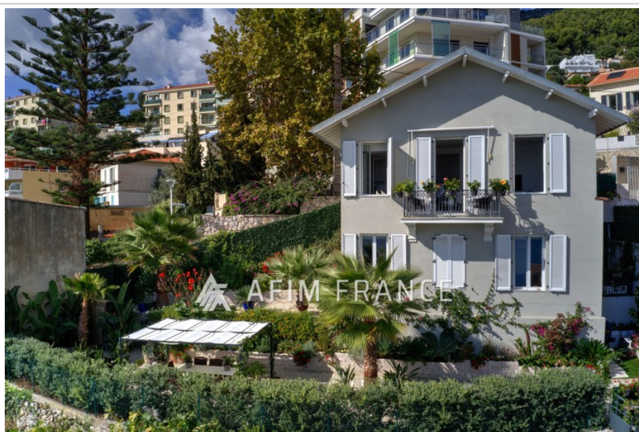
Villa 3101 Beausoleil

EXCLUSIMTE : Beausoleil, magnifique villa entièrement rénovée avec des prestations de qualité et son superbe jardin. Vue mer panoramique et sur Monaco. Composée d'un séjour avec cuisine américaine, un bureau, deux chambres, deux salles de douches, un dressing et une buanderie. La villa est vendue meublée. Deux garages fermés. Calme et lumineuse